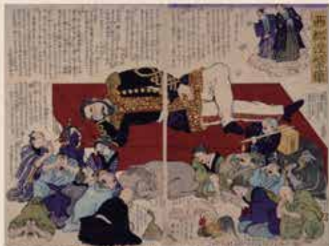
○永島孟斎「西郷涅槃像」 鹿児島市立美術館蔵