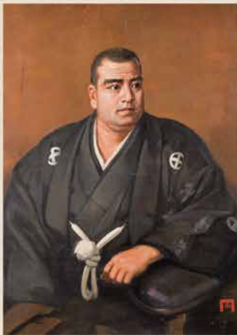
○作者不詳「西郷南洲翁像」 鹿児島市立美術館蔵

この機会に、しばし彼の人となり思いを馳せてみてはいかがでしょうか。それぞれの心に、〈私の西郷どん像〉が浮かび上がってくるかもしれません。